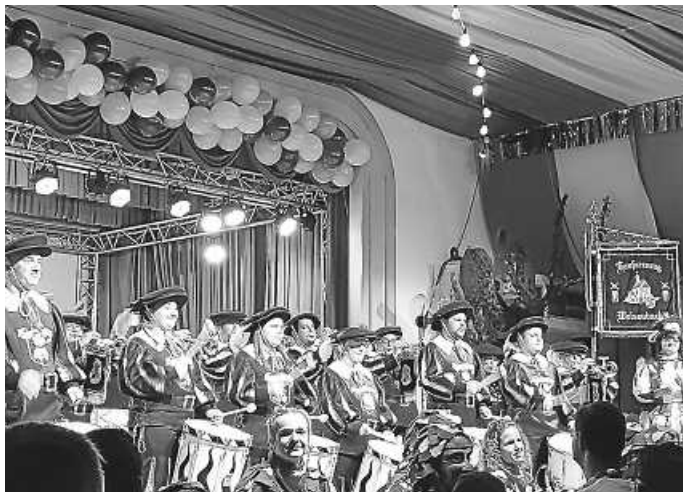
Volles Haus bei der Prunksitzung

Auf große Fahrt geht es am Fasntdienstag. Ein Bus voll Narren vom Fanfarenzug und den Eichos der KG fährt in die Landeshauptstadt. Auf Einladung der KG „Möbelwagen“ Stuttgart, werden wir am Stuttgarter Faschingsumzug teilnehmen. Es wird berichtet, dass die Stuttgarter mit vielen zig-tausend Zuschauern den größten Karnevalsumzug Baden-Württembergs durchführen. Der Umzug beginnt um 14 Uhr und führt direkt durch die Innenstadt, über Markt- und Schlossplatz zum Karlsplatz. Dort findet im Anschluss die große After-Show-Party von Antenne 1 statt. Fürs Fasntprogramm wünschen wir allen „Viel Spaß“ und grüßen mit „Hie Eicho“.