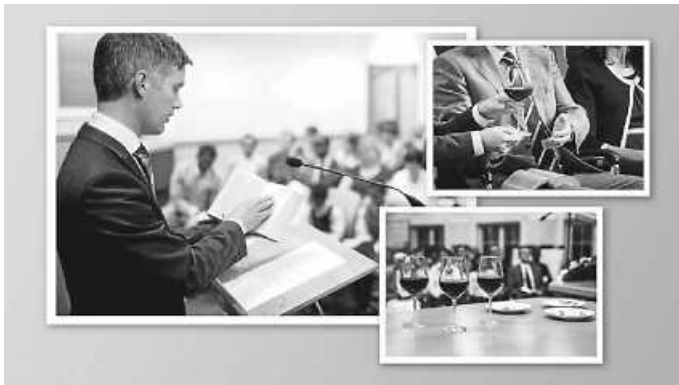
Ein Redner erklärt anhand der Bibel, was Jesu Tod möglich macht.

Wer den Hybrid-Gottesdienst übers Internet oder am Telefon mitverfolgen möchte, kann sich unter der Tel.-Nr. 07224 655661 anmelden. Eine Teilnahme ist kostenlos, keine Spendensammlungen, etc. Besucher sind immer willkommen.