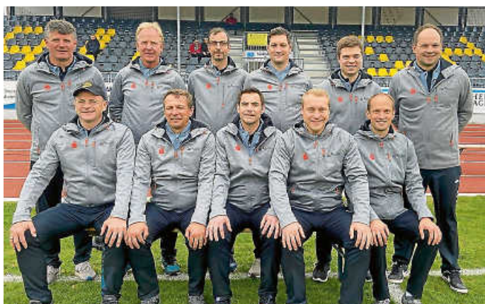
Bürgermeister der DFN Baden-Württemberg.

Am Sonntag konnte noch ein Teil der Mannschaft bei der Erstverleihung des Scholl-Grimminger-Preises anwesend sein. Zuversichtlich geht man nun in das „Turnier für den Frieden“, das vom 29. Mai bis 2. Juni 2022 in der Slowakei stattfindet.