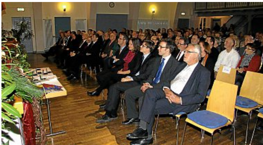
Zahlreiche Gäste beim Neujahrsempfang

Ohne die Hilfe von Ihnen, den Bürgerinnen und Bürgern wäre die Sanierung unseres Wahrzeichens, der Wendelinus-Kapelle, in diesem Umfang nicht möglich gewesen. Es ist ein gutes und hoffnungsvolles Zeichen für eine Gemeinde, wenn die Bürgerinnen und Bürger auf diese Art und Weise sich am Gemeindegeschehen beteiligen. Die zahlreichen positiven Rückmeldungen zeigen mir, wie wichtig die Maßnahme für sie alle war.