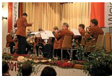
Musikalische Umrahmung durch die Musikkapelle Au