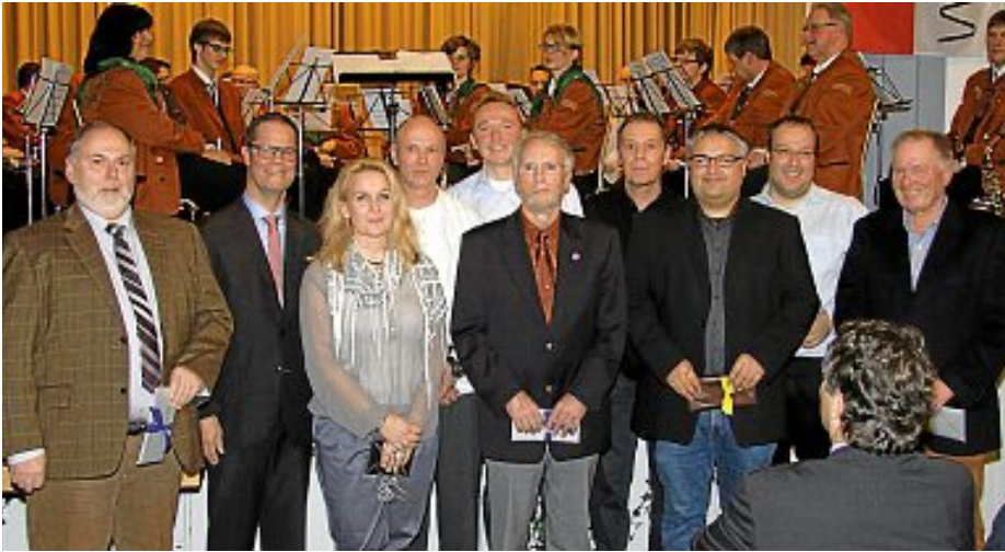
Mitglieder der Internetgruppe