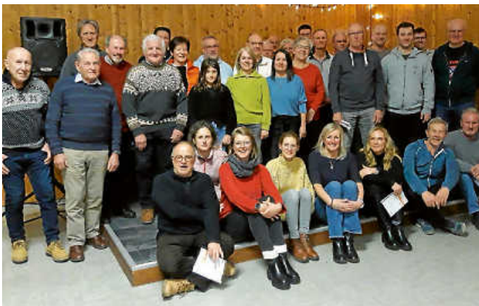
Verleihung Sportabzeichen 2023

Am Samstag, dem 13. Januar 2024, lud der Turnverein Weisenbach zu seinem traditionellen Wintergrillen in die vereinseigene Turnhalle ein. Trotz Minustemperaturen konnten die Gäste den Glühwein und das Gegrillte vom Holzfeuer im Freien genießen. Höhepunkt des Events war die anschließende Verleihung der Sportabzeichen für das Jahr 2023 in der Halle. Bei der Übergabe der Urkunden wurde betont, dass das Erreichen der geforderten Leistungen keineswegs selbstverständlich ist und ein regelmäßiges Training erfordert. Die Sportabzeichen wurden in verschiedenen Disziplinen wie Sportplatzaktivitäten, Schwimmen, Nordic Walking im Wald und Radfahren auf der Straße erworben. In diesem Jahr konnten beeindruckende 46 Sportabzeichen an die Teilnehmer verliehen werden. Besonders erfreulich war die Anzahl der Erstteilnehmer, die das Sportabzeichen erfolgreich erworben haben. Zudem konnte ein Sportabzeichen bereits zum 68. Mal überreicht werden, was in Baden-Württemberg als sehr selten gilt. Der Abend wurde mit einer ermutigenden Aufforderung, „weiter so“ und einem herzlichen „Interessenten sind gerne willkommen“, gemütlich verabschiedet.