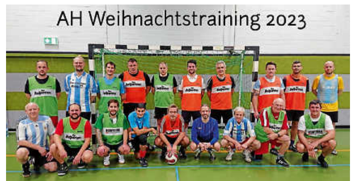
AH Weihnachtstraining 2023