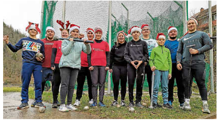
Zuerst Spaß - dann gute Leistungen beim Silvesterwerfen.