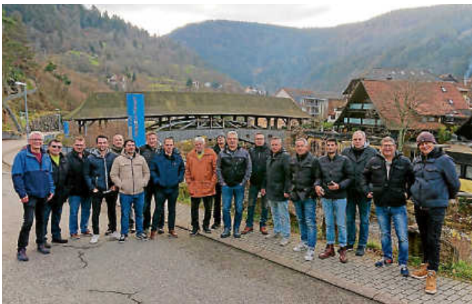
Gruppenbild der AH an der Holzbrücke Forbach.