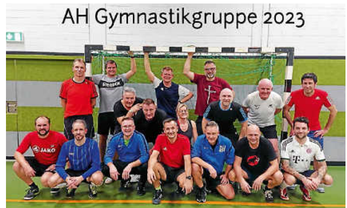
AH Gymnastikgruppe 2023