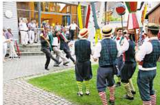
Feier vor dem Gemeindehaus