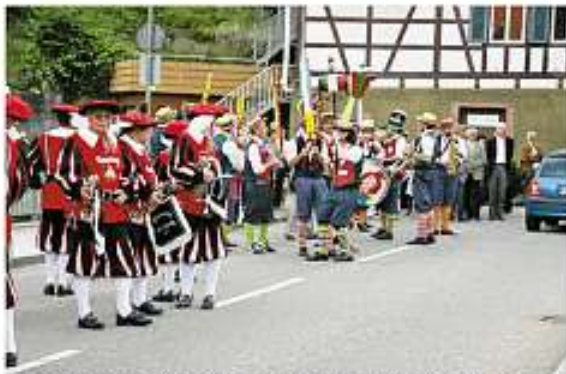
Fanfarenzug Weisenbach und La Matta San Costanzo