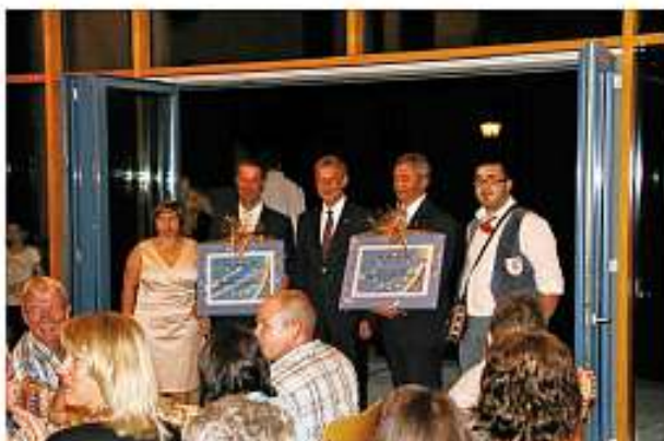
Ehrung durch Landrat Jürgen Bäuerle