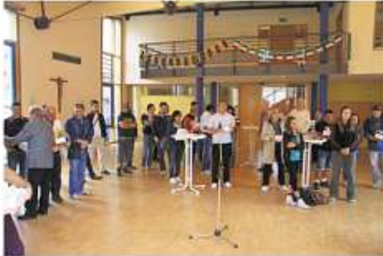
Empfang im Gemeindehaus