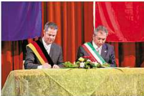
Unterzeichnung der Freundschaftsurkunden