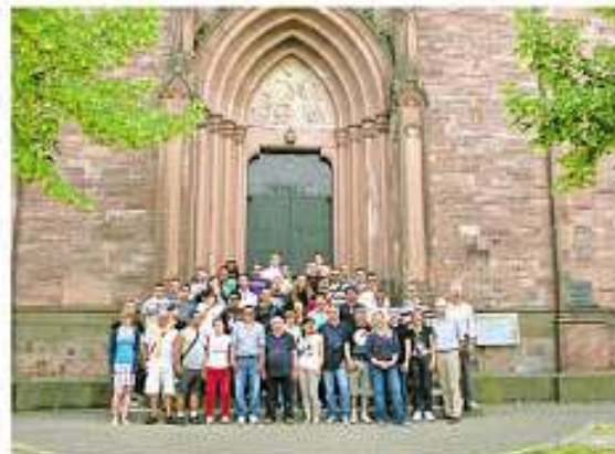
Abschlussbild vor der Kirche in Weisenbach