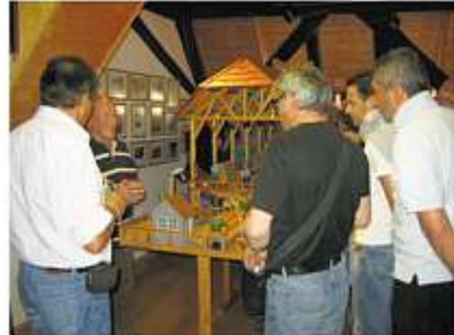
Reges Interesse im Heimatmuseum