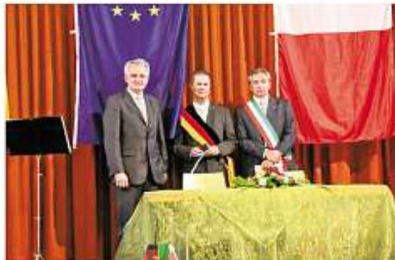
Überreichung der Europamedaille durch den europ. Vizepräsidenten Rainer Wieland, MdEP