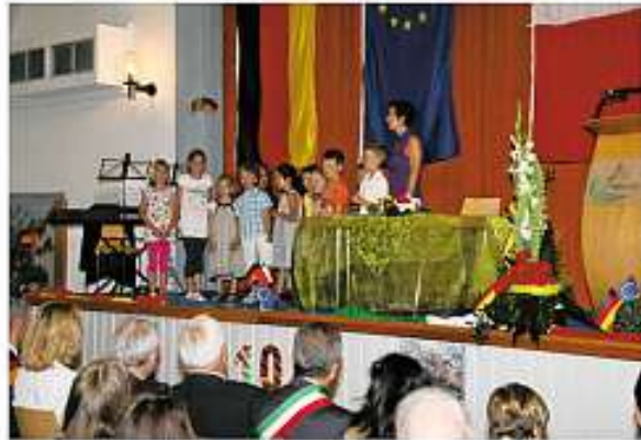
Eröffnung Festakt – Kinderchor des Kindergartens mit „Sei felice“