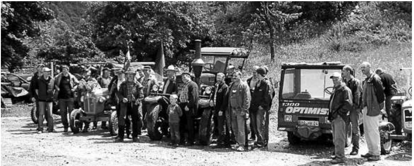
Traktorentreffen anlässlich des Stadtbahnocks.

Lassen Sie sich von unserem bekannten Mittagstisch (unter anderem gebratene Forellen) sowie einem abwechslungsreichen Kuchenbuffet und Eiskaffee verwöhnen. Die Veranstaltung findet bei jedem Wetter statt.