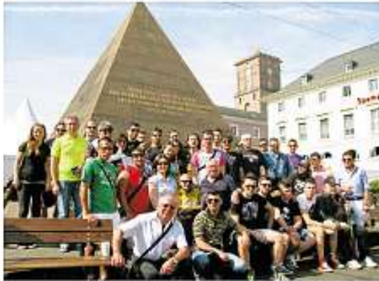
Besichtigung in Karlsruhe