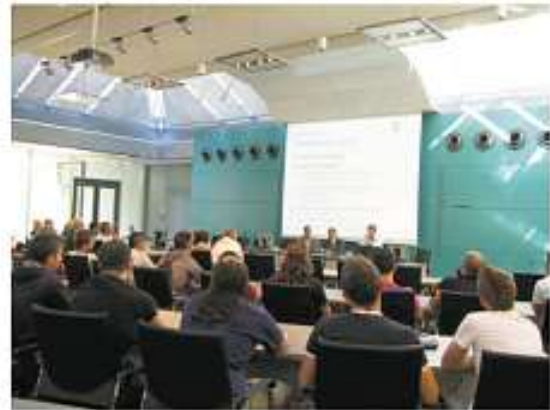
Vortrag über europ. Zusammenarbeit im Landkreis Rastatt