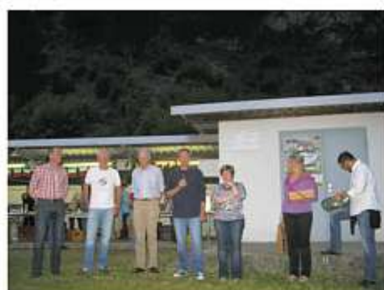
Ein „italienischer Dank“ an die Vereine im Schützenhaus