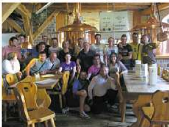
Bier brauen im Hopfenschlingel