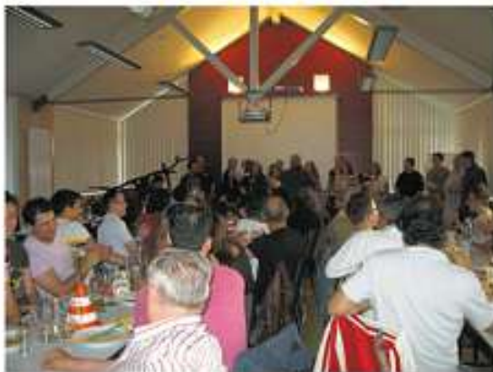
Der junge Chor der Eintracht Au begeistert die Besucher