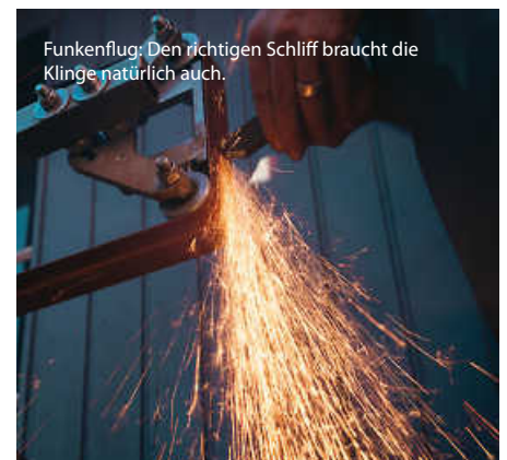
Funkenflug: Den richtigen Schliff braucht die Klinge natürlich auch.

Die Griffe werden je nach Gusto aus Holz oder Kunststoff hergestellt. Für den passenden Klingenschutz aus Leder sorgt auf Wunsch ein Sattler, sollen Griff und Schneideschutz aus demselben Holz sein, hilft ein Schreiner weiter. Individuelle Auftragsarbeiten nimmt Klases selbstverständlich auch an. Alles Handarbeit, aber das versteht sich irgendwie von selbst ... (es)