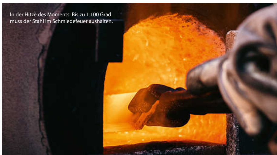
In der Hitze des Moments: Bis zu 1.100 Grad muss der Stahl im Schmiedefeuer aushalten.