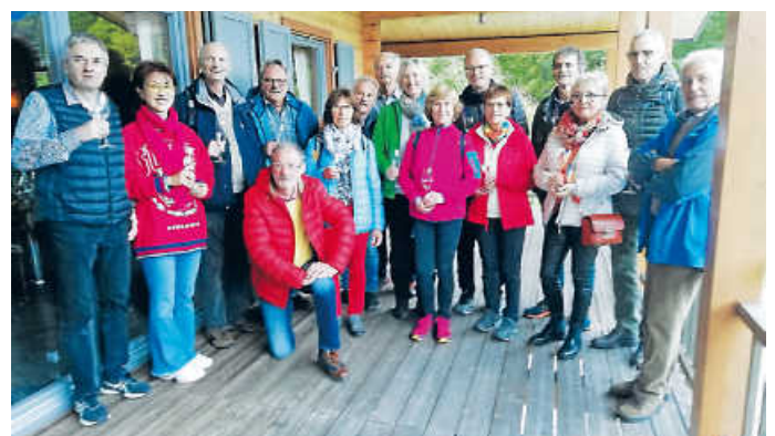
Besonderes Training der LAG-Sportler.