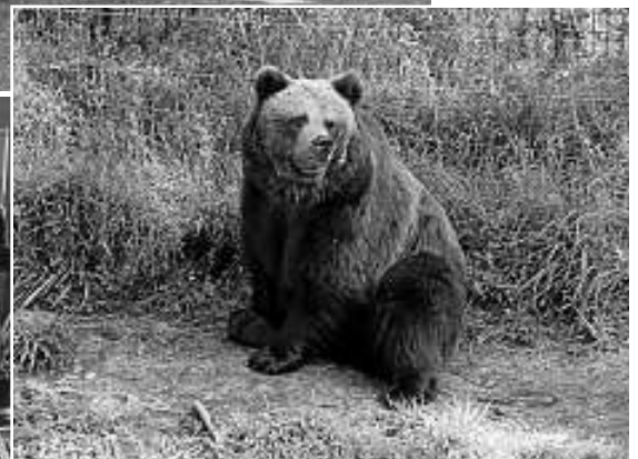
Ein besonderer Höhepunkt war auch der Wolf- und Bärenpark in Bad Rippoldsau-Schapbach sowie der Vogtsbauernhof in Gutach.