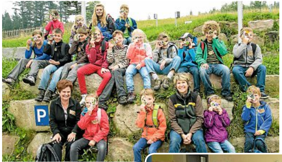
Wild ging es am Do., 04. September, auf dem Kaltenbronn zu ...

Am Montag, den 28. Juli, veranstaltete die Kolpingsfamilie eine Kinderolympiade beim Kolpinghaus.