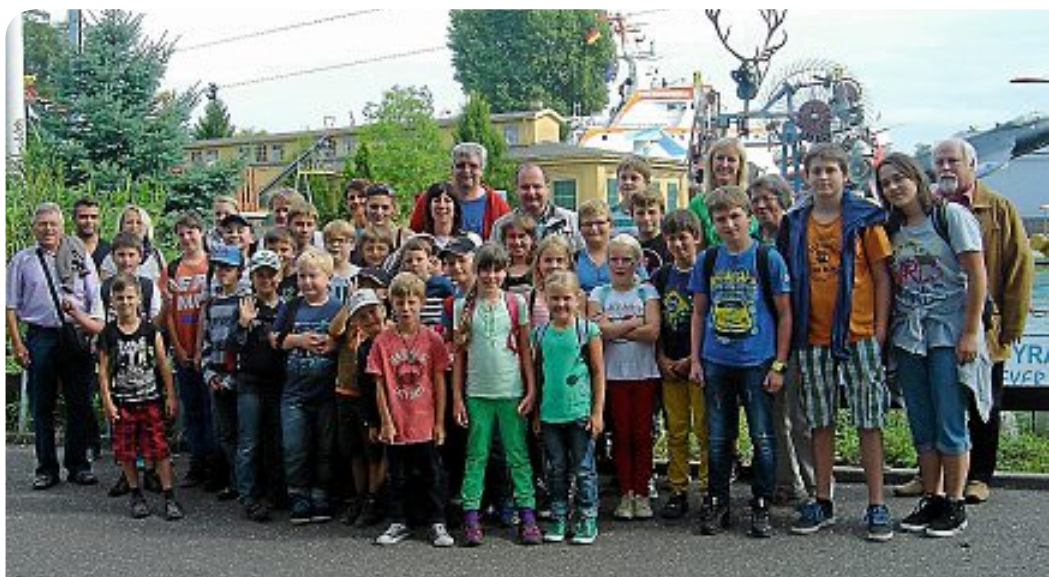
Alte Autos, Flugzeuge, Hubschrauber und noch viel Interessantes mehr konnte am Mi., 20. August, im Technikmuseum in Speyer betrachtet werden.

Am Samstag, den 23. August, wurden Menschen aus brennenden Häusern gerettet, Brände gelöscht und natürlich mit dem Feuerwehrauto