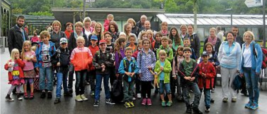
Auch wenn es den ganzen Tag regnete war der Ausflug in die Wilhelma am Mi., 13. August, sehr gelungen.