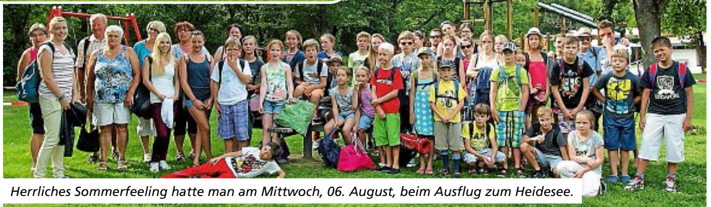
Herrliches Sommerfeeling hatte man am Mittwoch, 06. August, beim Ausflug zum Heidesee.