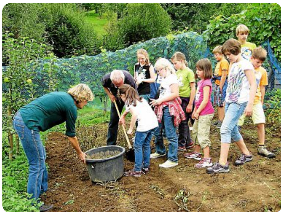
▲ Am Freitag, 29. August, wurde das Geheimnis der Pommes gelüftet.

Emil und seine Detektive stellte sich am Dienstag, den 02. September, in der Bücherei den Kindern vor.