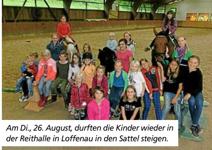
Am Di., 26. August, durften die Kinder wieder in der Reithalle in Loffenau in den Sattel steigen.

Da der Regen einfach nicht aufhören wollte und es mittlerweile ziemlich kalt war, musste das für den 16. und 17. August geplante Zeltlager leider abgesagt werden.