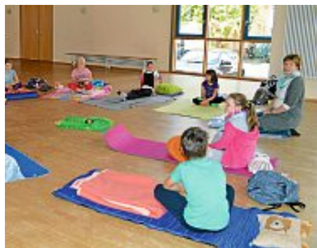
▲ Am Dienstag, den 19. August, konnten sich die Kinder vom Ferienstress erholen und entspannen ...

Am Montag, den 18. August hatten wir mal wieder sehr viel Spaß beim Bauernhof Seidt in Klosterreichenbach.