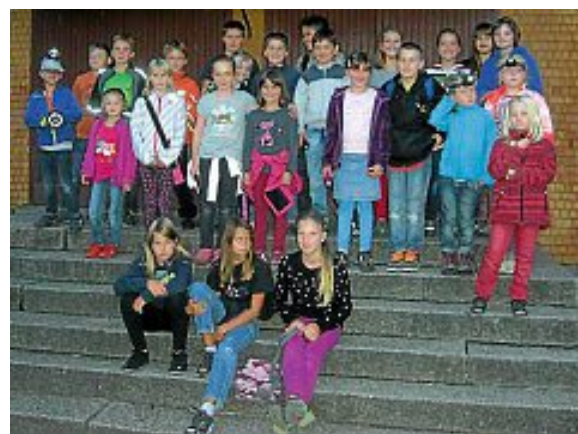
▲ Dass man sich bei Dunkelheit nicht fürchten muss, stellten die Kinder am Freitag, 5. September, fest.