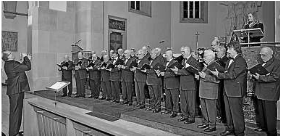
Gesangverein "Frohsinn Bad Rotenfels"