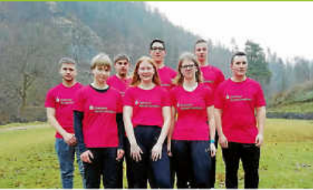
LAG Leichtathleten im Sparkassenkader

Amtsblatt der Gemeinde Weisenbach Diese Ausgabe erscheint auch online