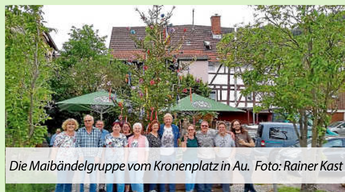
Die Maibändelgruppe vom Kronenplatz in Au.