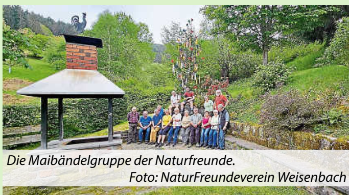
Die Maibändelgruppe der Naturfreunde.