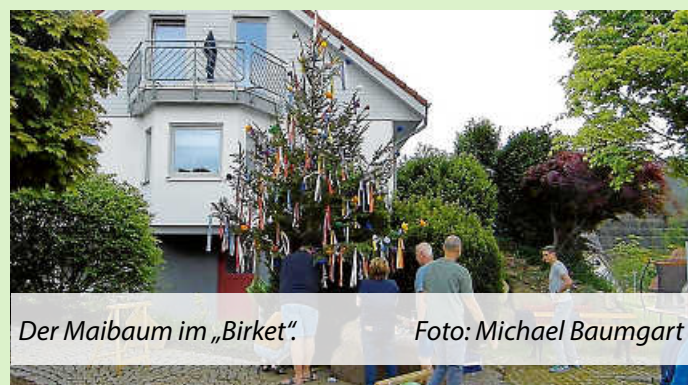
Der Maibaum im „Birket“.