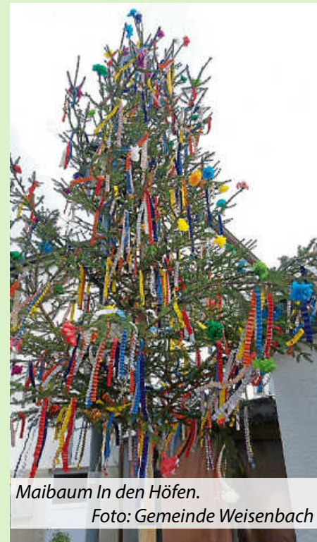
Maibaum In den Höfen.

Wir bedanken uns bei allen aktiven Maibaumgruppen für ihr Engagement und die Aufwertung unseres Ortsbildes mit ihren wunderschönen Bäumen.