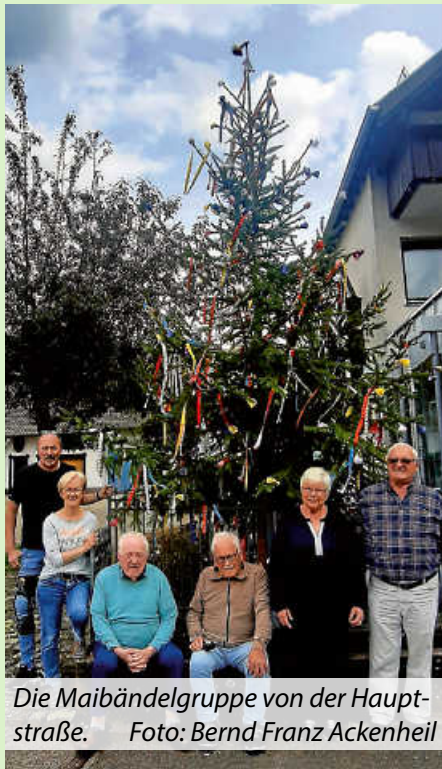
Die Maibändelgruppe von der Hauptstraße.

Pünktlich trafen sich bereits in den vergangenen Wochen die verschiedenen Maibaumgruppen in Weisenbach, um die „Bündel“ für die prächtigen Maibäume vorzubereiten.