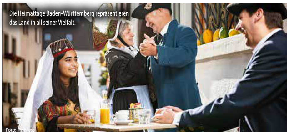
Die Heimattage Baden-Württemberg repräsentieren das Land in all seiner Vielfalt.