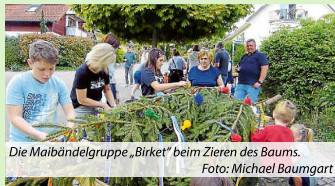
Die Maibändelgruppe „Birket“ beim Zieren des Baums.