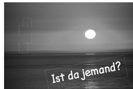
Nähere Informationen im Evangelischen Pfarramt, Schifferstraße 13, 76596 Forbach, Tel. 07228/2344