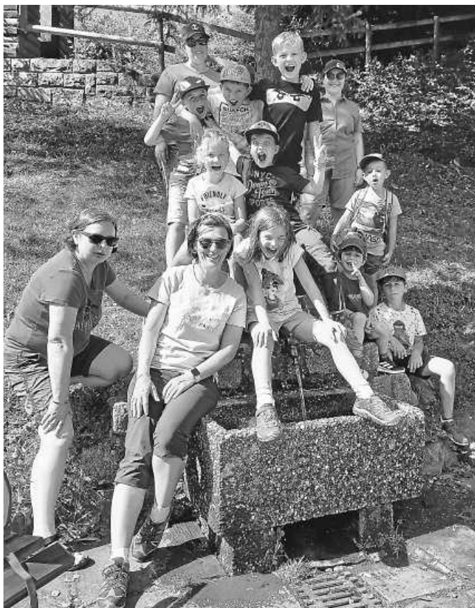
Viel Spa hatten die Kinder bei der Schnitzeljagd.

Seit Juli 2021 hat auch der Musikverein wieder seinen Probenbetrieb aufgenommen. Am vergangenen Donnerstag bot es sich aufgrund der guten, trockenen Wetterlage an, die Probe ins Freie auf den Schulhof zu verlegen. Deshalb waren im Dorf bekannte Melodien von der Sudbohmischen Polka uber die Schlagerlegenden von Connie Francis bis zu Oye Como Va zu horen. Die Musikerinnen und Musiker hoffen, auch den ein oder anderen Burger mit diesen Liedern erfreut zu haben.