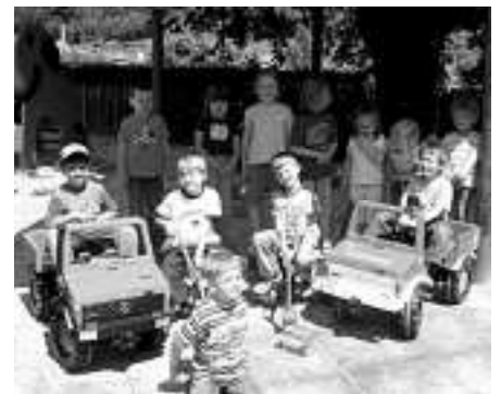
Die „kleinen Strolche“ freuen sich über die Tretfahrzeuge

Mit einem großen Zeltfest feierte der Gesangverein "Eintracht" Au vom 26. – 29. Juni sein 125jähriges Vereinsbestehen.