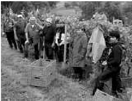
Weinlese im „Kapf“

Am 17. September wurde im Weinberg „Kapf“ mit der ersten Weinlese, dem Müller-Thurgau, begonnen. Der Müller-Thurgau dürfte der erste Wein des „Weingutes Strobel“ sein, der dann im Frühjahr 2010 auf den Markt kommt.