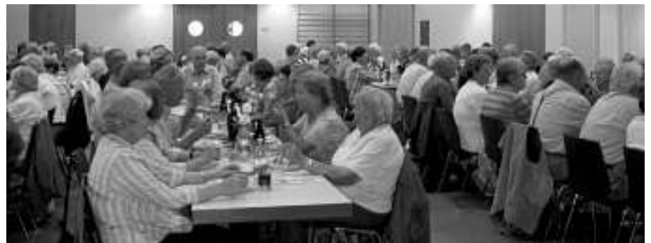
Abschluss in der Festhalle in Bernersbach

121 Seniorinnen und Senioren nahmen am Seniorenausflug nach Trochtelfingen und Hechingen teil. Der gesellige Abschluss fand in der Festhalle in Bernersbach statt.