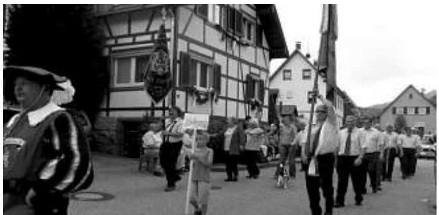
Festumzug in Au