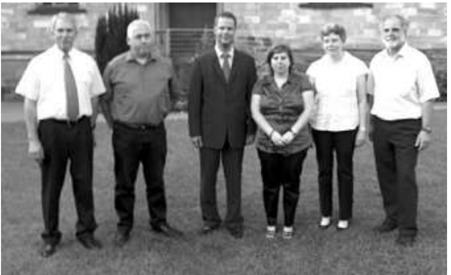
Die ausgeschiedenen Mitglieder des Gemeinderates