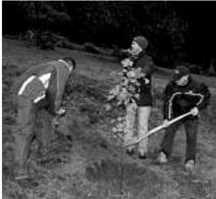
Pflanzung eines Bergahorns

Nachdem dem Weisenbacher Gemeinderat nach der letzten Wahl fünf neue Mitglieder angehören, wurde bei der Waldbegehung der Schwerpunkt der Ausführungen auf die Grundlagen der Forst- und Waldwirtschaft gelegt. Wie bereits die Jahre zuvor, wurde auch wieder eine Neupflanzung eines Baumes, und zwar eines Bergahorns, vorgenommen.