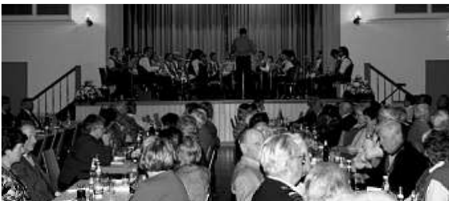
Seniorenfeier in der Festhalle

Rund 200 ältere Bürgerinnen und Bürger folgten der Einladung der politischen Gemeinde sowie der katholischen und evangelischen Kirchengemeinde zum Seniorennachmittag in die Festhalle. Das