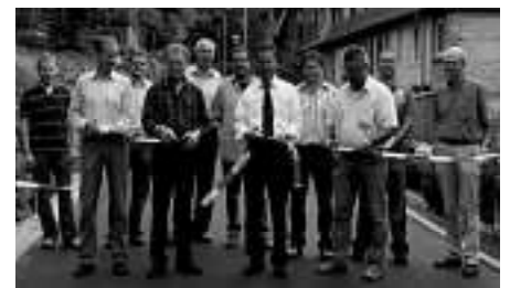
Freigabe der Koloniestraße

Rund 3 Monate nach dem Spatenstich konnte die Sanierung an der Koloniestraße abgeschlossen und die Straße für den Verkehr wieder freigegeben werden.