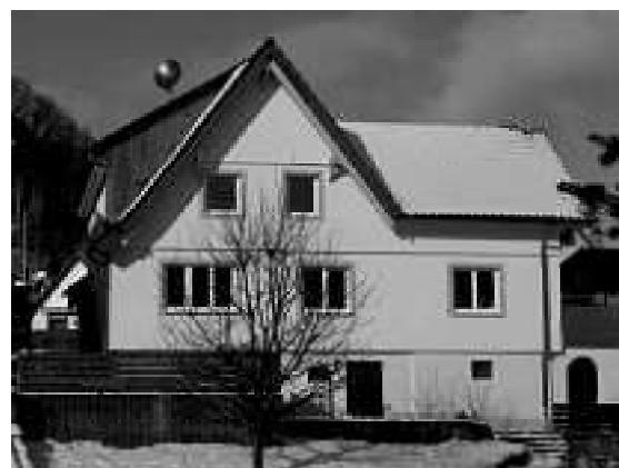
nach der Sanierung