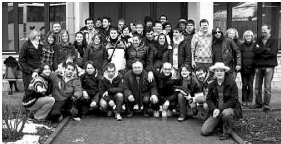
Jugendaustausch San Costanzo-Weisenbach

von Gerätschaften zur verbesserten Landschaftspflege überreicht.