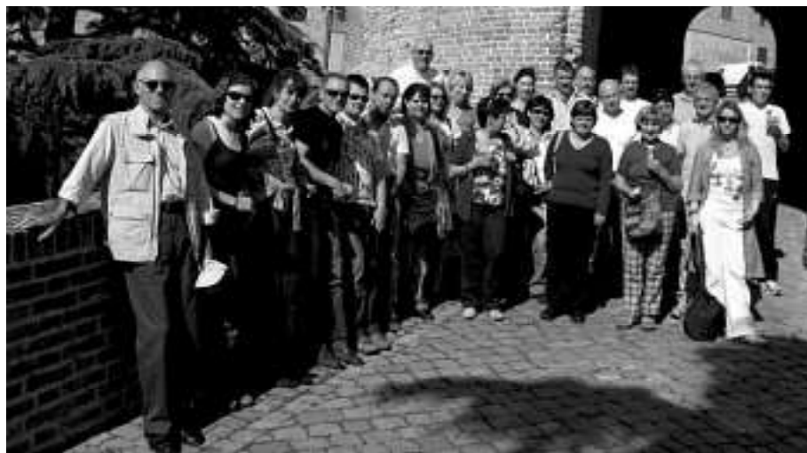
Reisegruppe in den Burganlagen von Mondavio

In der Sitzung am 14. Mai hat der Gemeinderat den vorhabenbezogenen Bebauungsplan mit dem Vorhaben- und Erschließungsplan „Hauptstraße/ Eisenbahnstraße“ (ehemaliges Hirsch-Gelände) beschlossen.