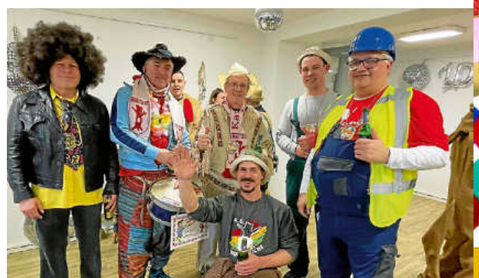
Es ist „geschafft“, das Rathaus ist übergeben