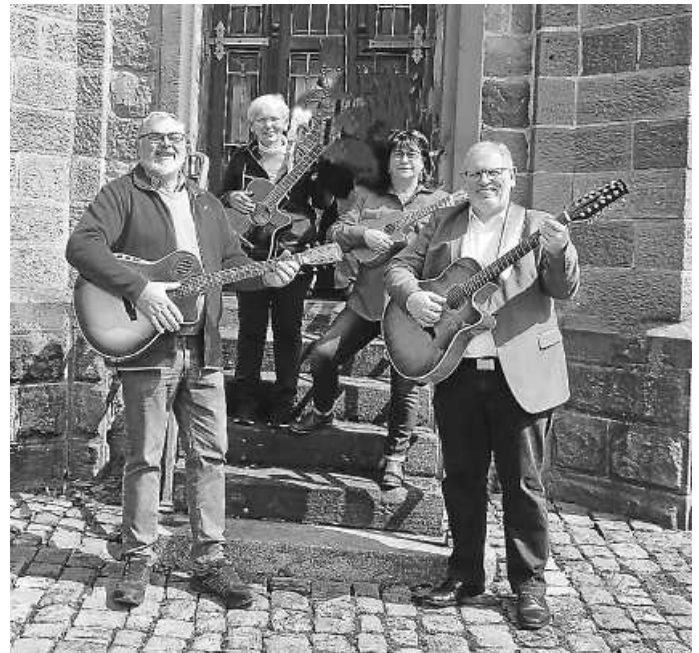
Begleiten den Gottesdienst am Sonntag - das Quartett „d'Combo“ Foto: Herbert Fritz - „d'combo“

Die nächste Probe des Lobpreischores findet am 19. Februar um 20 Uhr in Forbach statt