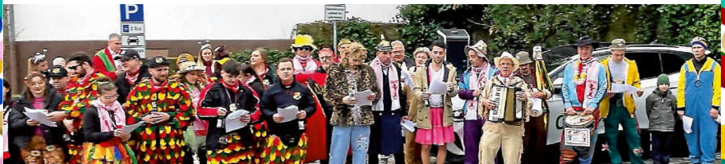
Die Narren singen kräftig mit