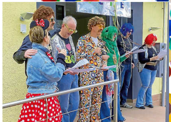
Gemeinsam singt man bekannte Lieder