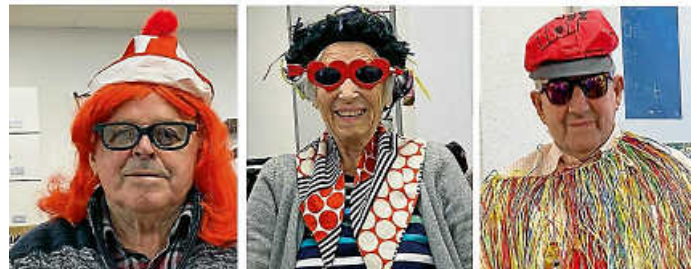
Das Kostümspiel brachte alle zum Lachen