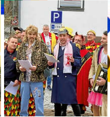
Der Ortsbützel „schmeißt die Mitarbeiter raus“