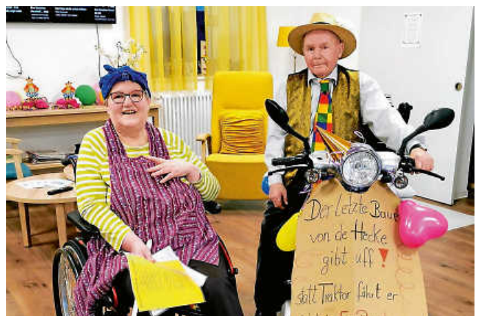
Unsere Büttenrednerin und Der letzte Bauer von der Hecke, der aufgibt und statt Traktor jetzt einen E-Porsche fährt

Die närrische Zeit machte natürlich auch vor der Tagespflege keinen Halt. Es herrschte ausgelassene Stimmung und die tägliche Büttenrede durfte nicht fehlen. Oft wurde über die Kostümierungen und Auftritte gestaunt - und vor allem wurde ganz viel gelacht.