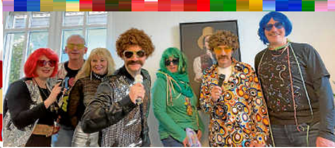
Das Rathaus-Team ist bereit für den Sturm