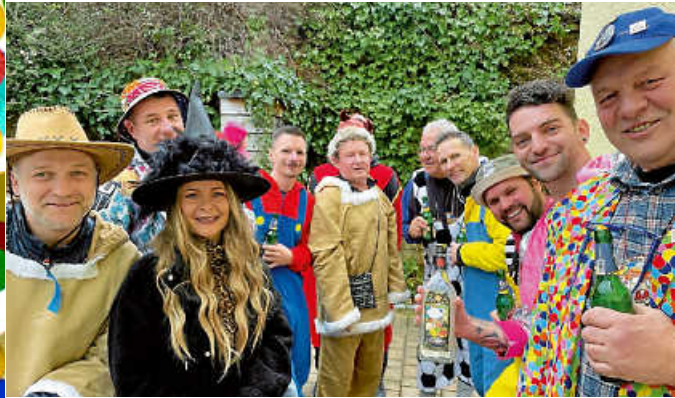
Die Narren stürmen das Rathaus