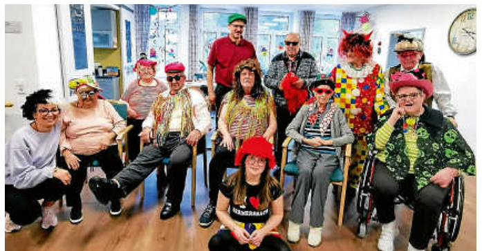
Gruppenbild am Schmutzigen Donnerstag

Die närrische Zeit machte natürlich auch vor der Tagespflege keinen Halt. Es herrschte ausgelassene Stimmung und die tägliche Büttenrede durfte nicht fehlen. Oft wurde über die Kostümierungen und Auftritte gestaunt - und vor allem wurde ganz viel gelacht.