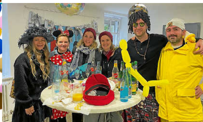
Gemeinsamer Ausklang im Rathaus