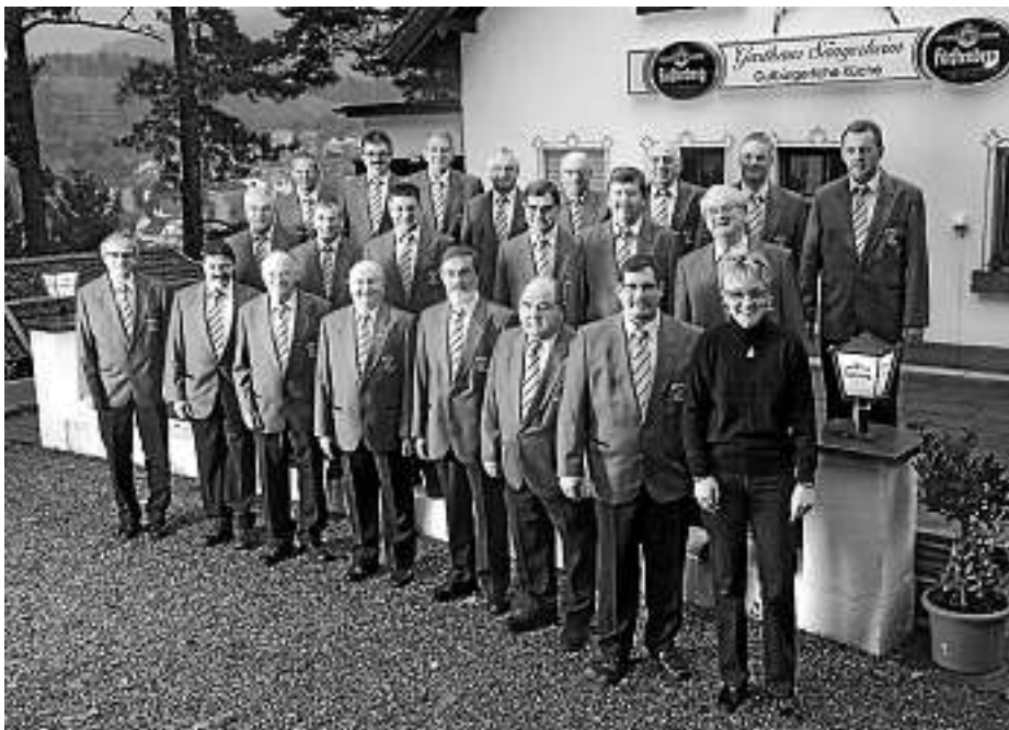
Der Männerchor im Jubiläumsjahr.

Chorproben am Freitag, 3. April, im Sängerkheim: 18 Uhr junger Chor, 19.30 Uhr gemischter- und Männerchor.