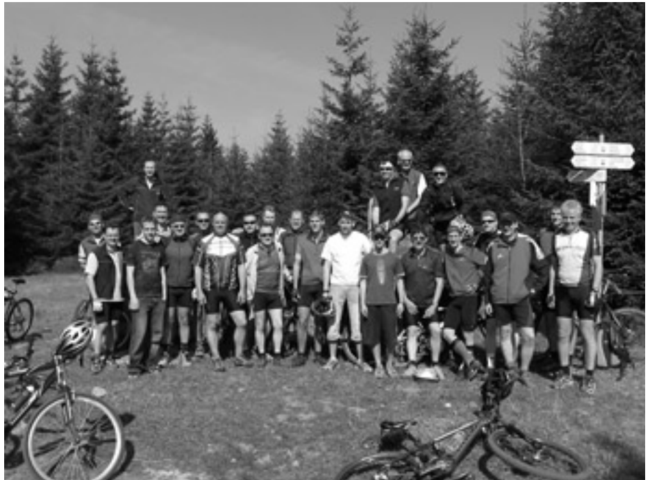
Die Teilnehmer der Weisenbacher Sternfahrt zur Eröffnung der MTB-Arena Murg-/Enztal.

derer Dank gilt den freiwilligen Helfern und der Gemeinde Weisenbach für die Unterstützung bei der Durchführung der Sternfahrt.