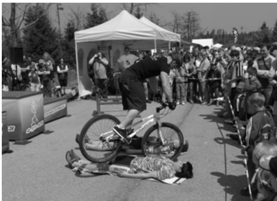
Die »Funky-Bike-Boys« in Aktion.

Bei den aus den Teilnahmeorten angebotenen Sternfahrten waren schon am frühen Morgen viele Biker unterwegs. Auch aus Weisenbach