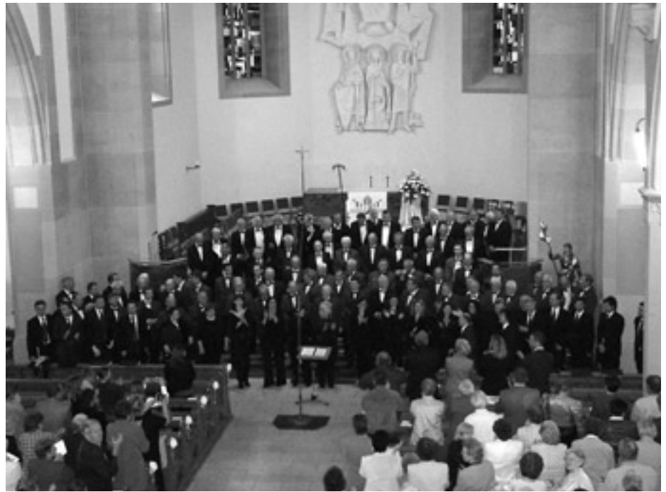
Die drei Chöre in der Weisenbacher Kirche.