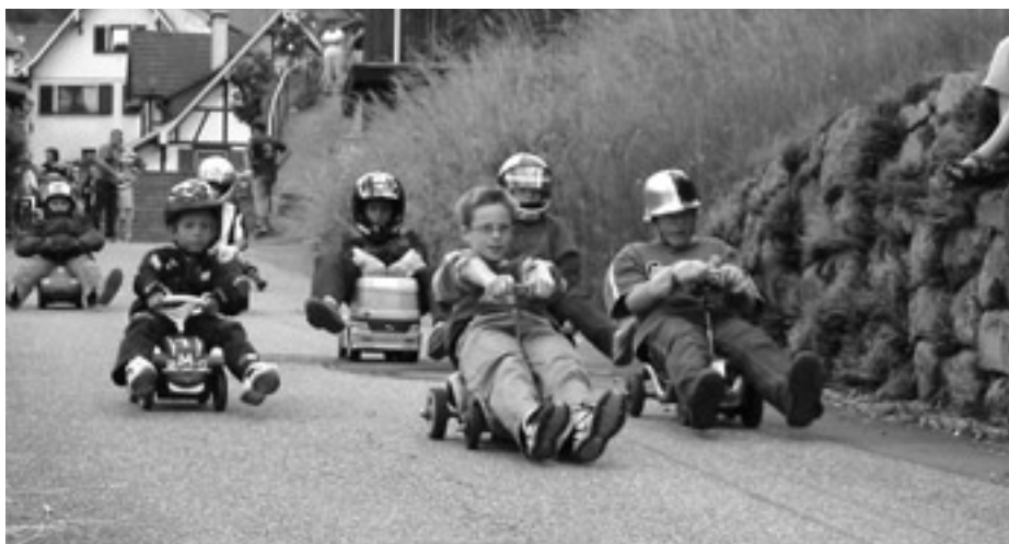
Bald kann wieder um den »Großen Preis von Au« gefahren werden.

Für den leiblichen »Boxenstop« ist bestens gesorgt. Anmeldung an Bobbycar@gruppe-akw-philipsburg.de oder Telefon 07224 916938. Die Startgebühr beträgt zwei Euro.