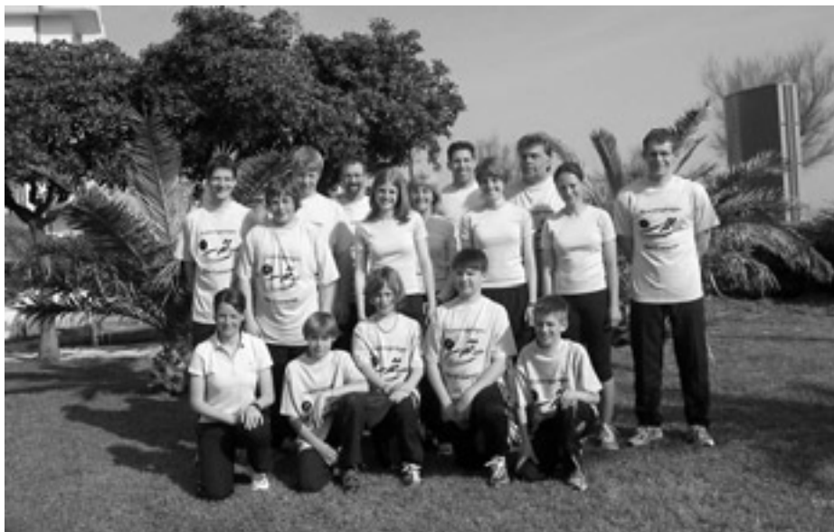
Leichtathleten der LAG Obere Murg in der Weisenbacher Partnergemeinde San Costanzo in Italien.

Bereits zum 6. Mal verbrachten die Leichtathleten der LAG Obere Murg vom 13. - 22. April ihr Ostertrainingslager in der Weisenbacher Partnergemeinde San Costanzo in Italien. Erstmals waren in der Trainingsgruppe von 16 Sportlern und Sportlerinnen auch die Hammerwerfer mit ihrem Trainer Bernd Wörner mit dabei. Untergebracht war die Gruppe wieder im Hotel Imperial direkt am Strand. Dies wurde ausgiebig genutzt für die morgendlichen Strandläufe und die »Stabi-Übungen« auf dem Hoteldach. Ganz Mutige wagten bei angenehmen Außentemperaturen sogar schon ein erfrischendes Bad im Pool und im Meer. Die Hammerwerfer trainierten im Stadion von Senigallia und alle anderen Sportler und Sportlerinnen in der Rastatter Partnerstadt Fano.