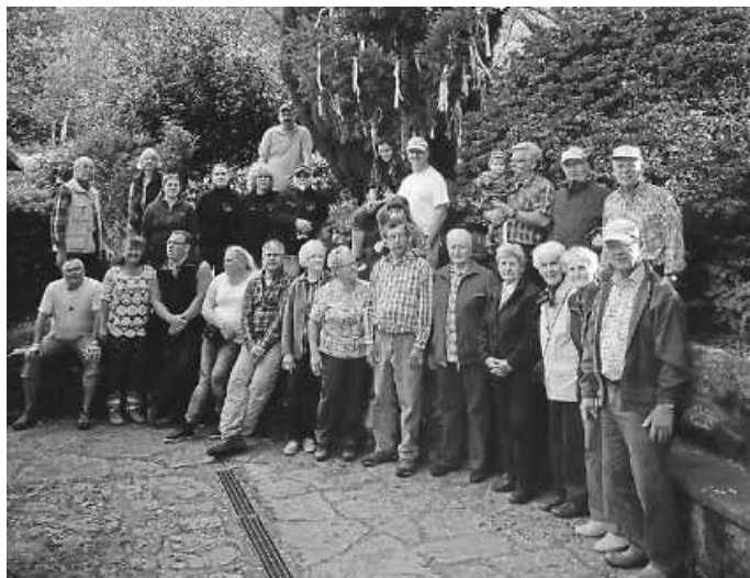
Ankündigung Wanderung in den Mai.

Zur traditionellen Mai Wanderung treffen sich die Naturfreunde am 30. April 2022 um 14.00 Uhr bei Artur in der Weng. Nach einer kurzen Einstimmung geht's weiter zur Neichel Ranch, übers Brünnele zum Naturfreundehaus am Sennel. Wir freuen uns auf euch - Naturfreunde Weisenbach. www.naturfreunde-weisenbach.de