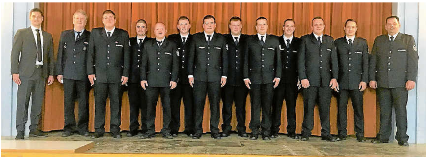
Neu gewählter Feuerwehrausschuss.