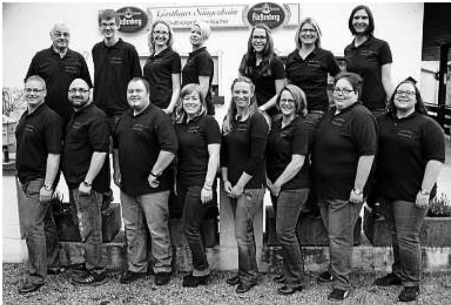
„Junger Chor“ des Gesangvereins Eintracht Au wirkt bei „Church meets Gospels“ beim Benefizkonzert für die Renovierung der Kirche Maria Königin in Au mit.

Volksbank Baden-Baden/ Rastatt, BLZ 662 900 00, Konto- Nr.: 58 549 100