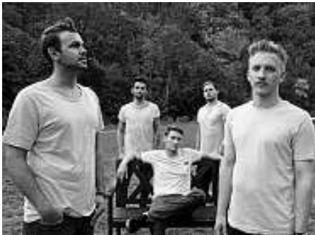
Fireworks & Fairytales