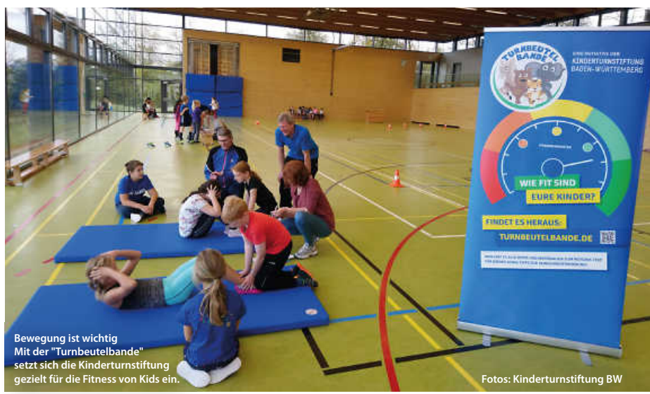
Bewegung ist wichtig Mit der „Turnbeutelbande“ setzt sich die Kinderturnstiftung gezielt für die Fitness von Kids ein.

Übrigens: Für die fünf ersten Kommunen, die den Motorik-Test für Kinder bei sich durchführen wollen, bietet die Kinderturnstiftung Baden-Württemberg eine kostenlose digitale Schulung an. Im Rahmen der etwa zweistündigen Veranstaltung wird der Test vorgestellt und es werden Tipps zur erfolgreichen Organisation und Durchführung gegeben, Kontakt hier: info@turnbeutelbande.de (pm/red)