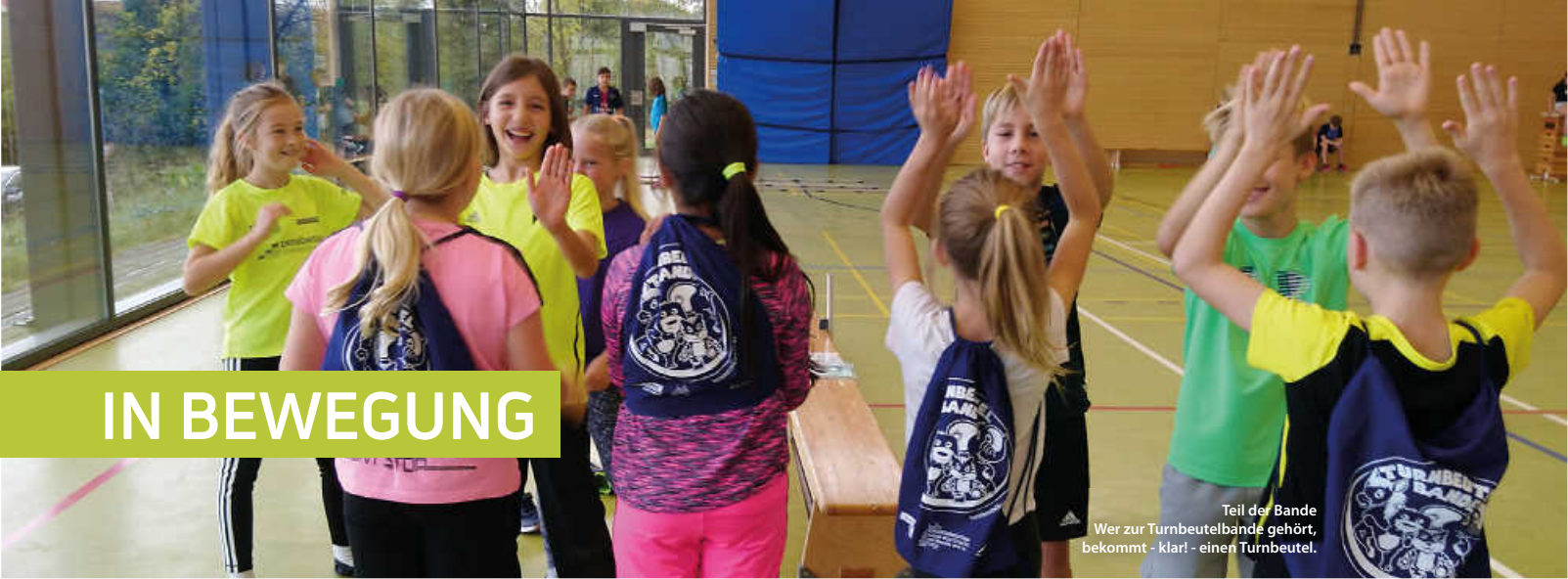
Teil der Bande Wer zur Turnbeutelbande gehört, bekommt - klar! - einen Turnbeutel.