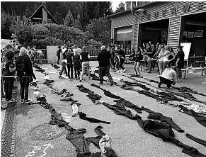
Spiel ohne Grenzen