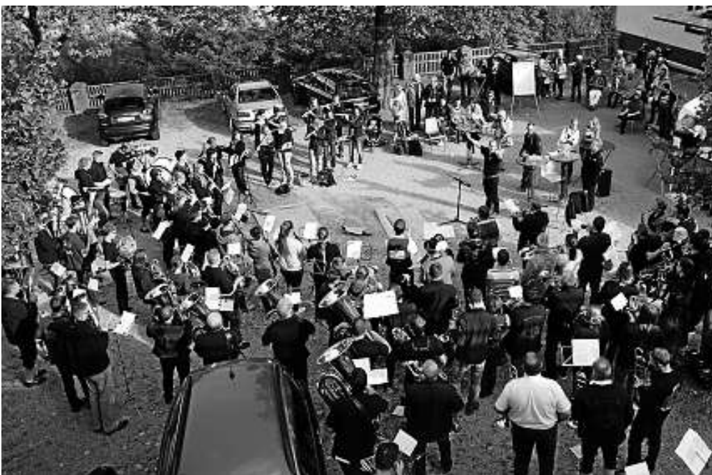
Abschlussmusizieren aller 4 Kapellen