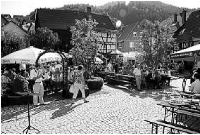
Die Reisegruppe besucht den Fröhlichen Feierabend in Au.