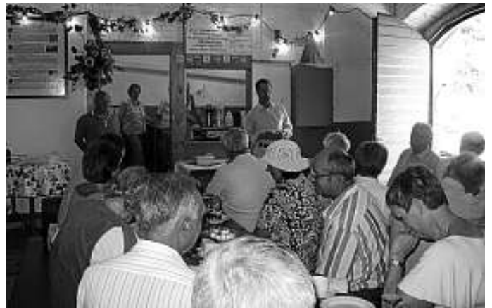
In der Kelterstube bewirbt der Heimatpflegeverein die Gäste.