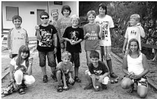
Der Freizeitclub Weisenbach lud zum Weisenbacher Boule-Turnier ein.