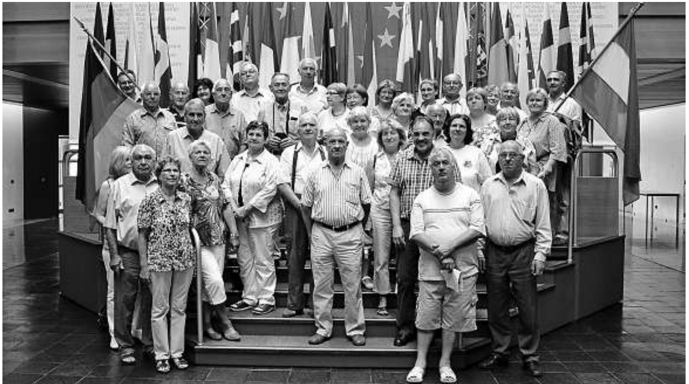
Die Reisegruppe sowie Mitglieder des Heimatpflegevereins im Europäischen Parlament in Straßburg.