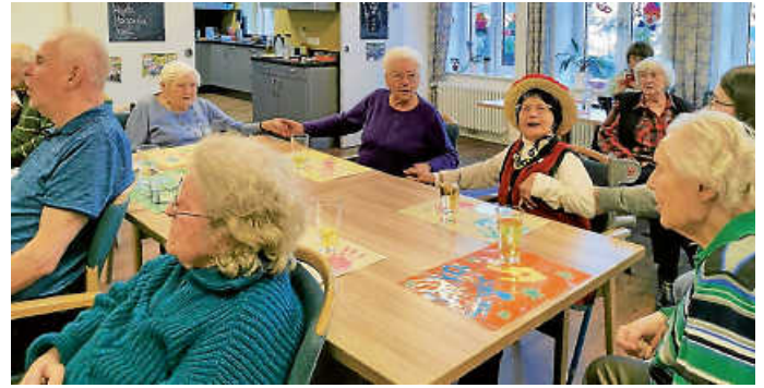
Und Sitztanz mit Schunkeln ist immer angesagt