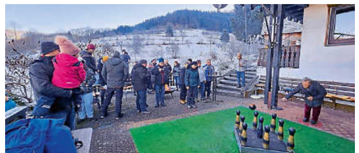
Winterkegeln bei den NaturFreunden