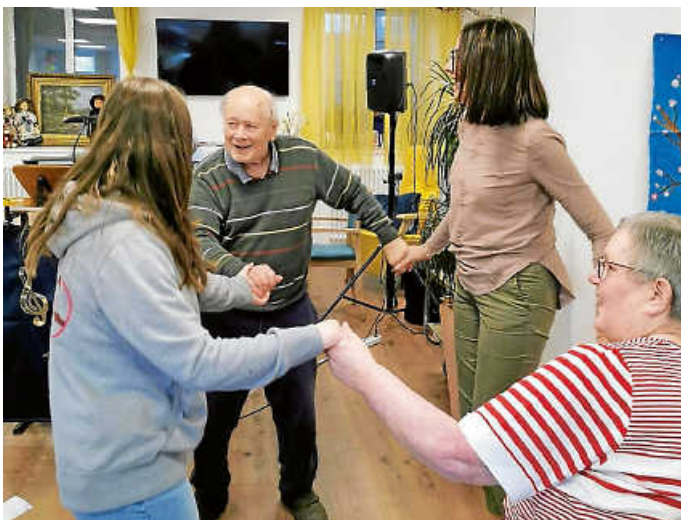
Es wird auch das Tanzbein geschwungen