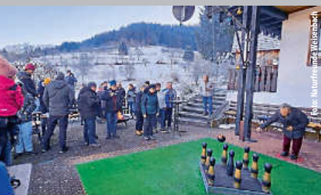
Winterkegeln bei den Naturfreunden Weisenbach

Einladung zur Informationsveranstaltung zum Sanierungsgebiet Ortsmitte II