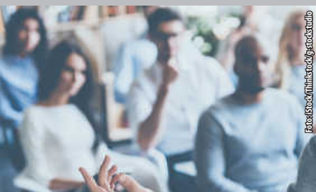
Gemeinderatssitzung heute Abend um 19.00 Uhr