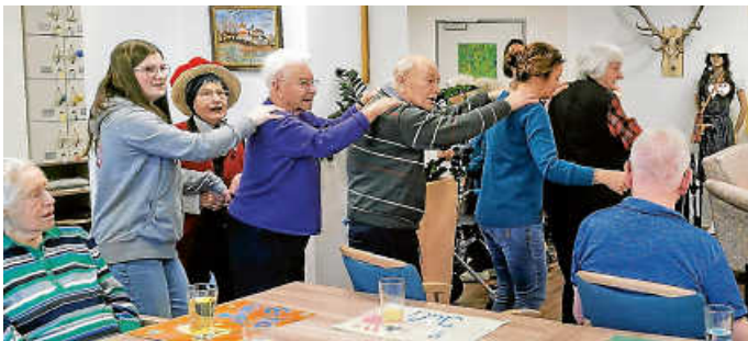
Polonaise durch die Tagespflege

Der Vortrag findet in den Räumlichkeiten der Tagespflege Murgtal statt: Erdgeschoss des ehemaligen Kreiskrankenhauses Forbach (Friedrichstr. 17). Die Veranstaltung ist kostenfrei. Wir bitten um Voranmeldung per Telefon oder E-Mail bis Montag, 29.01.2024. Telefon: 07228 6259850, E-Mail: tagespflege@sst-forbach.de