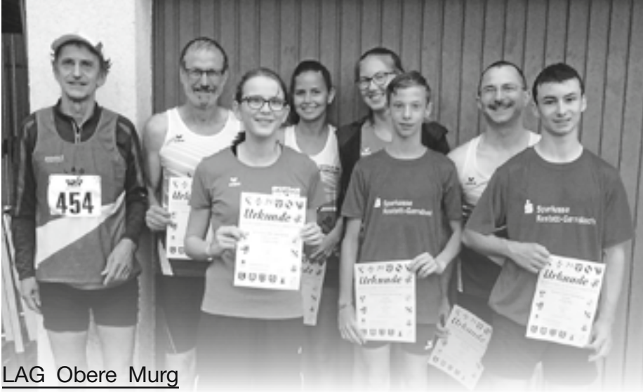
LAG Obere Murg