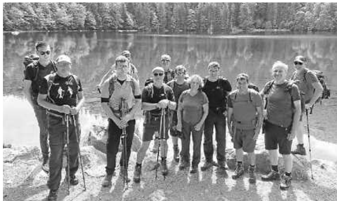
Unsere Wandergruppe am Feldsee

An den zwei Tagen wanderte die Gruppe knapp 34 Kilometer bei vielen Höhenmetern im Auf- und Abstieg. Eine wunderschöne 2-Tagestour mit Übernachtung direkt im Wandergebiet bei bestem Wetter und einer tollen Gruppe.