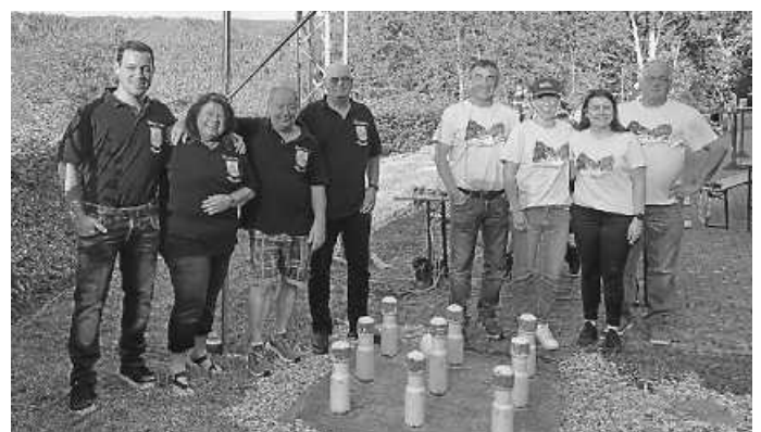
Erfolgreich beim Moonlightkegeln