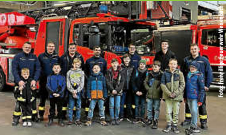
Ausflug der Jugendfeuerwehr

Amtsblatt der Gemeinde Weisenbach Diese Ausgabe erscheint auch online