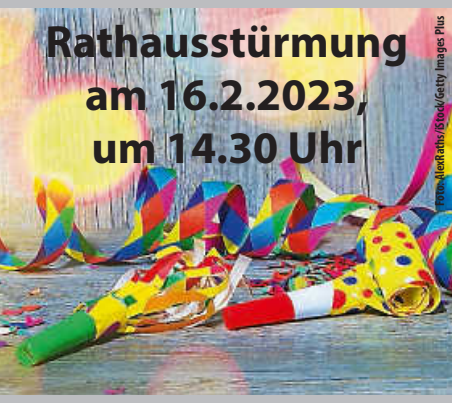
Rathausstürmung am 16.2.2023, um 14.30 Uhr