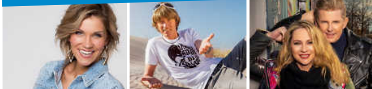
Anna-Maria Zimmermann, Mickie Krause, Markus und Yvonne (Neue Deutsche Welle)