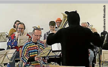
Närrische Musikprobe im Helmut-Dahringer-Haus